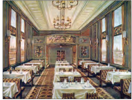
Kuva teoksesta: Die Breitspurbahn

Pikajunien matkustusmukavuus olisi ollut lähes keskitason hotellien luokkaa. Suunnitelmissa oli lukuisia matkustajavaunutyyppejä 1., 2. ja 3. luokan paikkoineen. Tarkoitus oli valmistaa myös ravintolavaunuja ruokasaleineen, näköalavaunuja sekä kylpyvaunuja parturi-kampaamoineen ja konditorioineen. Jopa elokuvateattereita suunniteltiin.