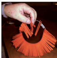
OSTA ARPOJA. Tue toimintaamme!