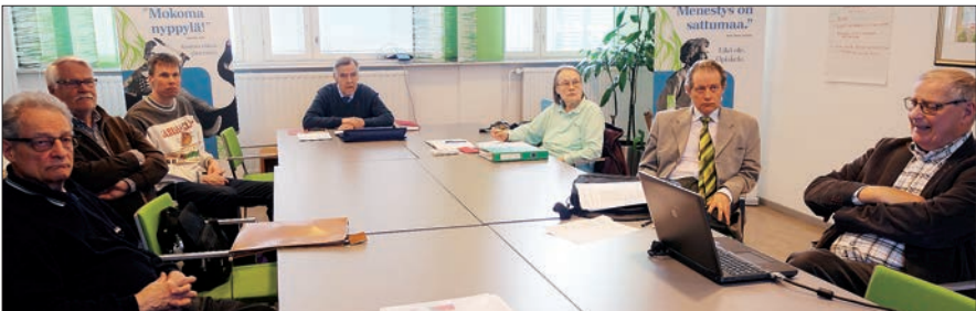
Vuosikokouksen osanottajia seuraamassa kokousta.