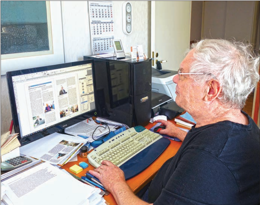
Upseerifilatelisti-lehden tekoa tänä päivänä.