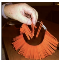
OSTA ARPOJA. Tue toimintaamme!