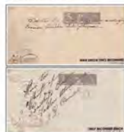
Two very scarce postholes, where a 100 riksdaler printed on paper of 1000 (1000) is cancelled, where no paper is there. A 100 riksdaler printed on paper of a 100 (100) is cancelled, where no paper is there. The cancelled values are shown.

The treatment is balanced with unused and used stamps, different types and sub-types of paper, watermark, cancelled and the manuscript cancellations, cancelled by multiple letters and strips of three) and original Royal Stamp Duty Deceives.