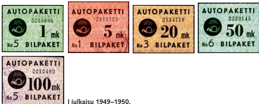
I julkaisu 1949–1950.