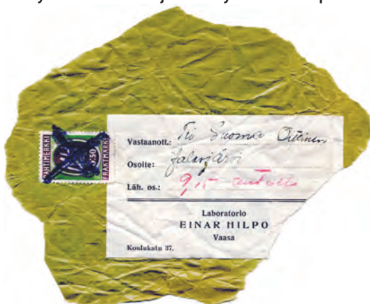
Esimerkki paketin päälle kiinnitetystä maksusuorituksesta.