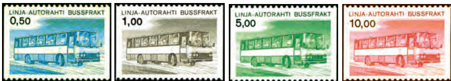
IV julkaisu 1981.