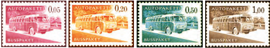
III julkaisu 1963.

Rahanuudistuksen yhteydessä muutettiin myös autopaketimerkkien rahayksikkö nykymarkoiksi ja painoasu ja painotekniikka vastaamaan ajan haasteisiin. Nämä merkit painettiin kahtena 50 kappaleen arkkina, joista nyt tehtiin 20 x 5 merkin vihkoja liikenteessä käytettäviksi. Tässä julkaisussa on käytetty saman aikakauden postimerkkipapereita. Merkkejä painettiin useita painoeriä ja ne olivat 0,05 mk punainen, 0,20 mk oranssi, 0,50 mk sininen ja 1,00 mk ruskea.