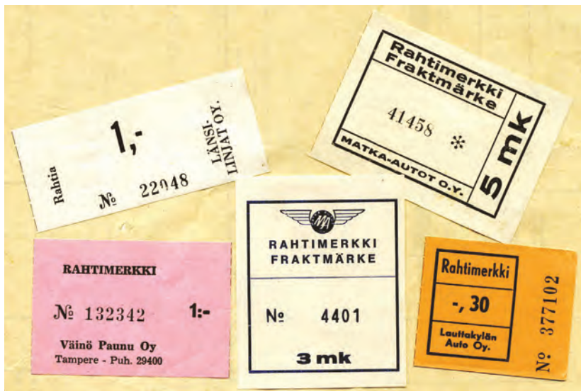
Yksityisten liikennöitsijöiden käyttämiä omia pakettimerkkejä.