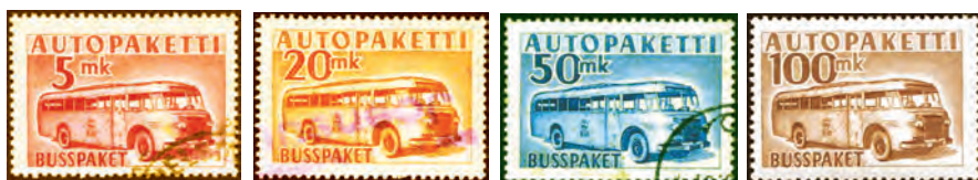
II julkaisu 1952–1958.