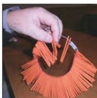
OSTA ARPOJA. Tue toimintaamme!