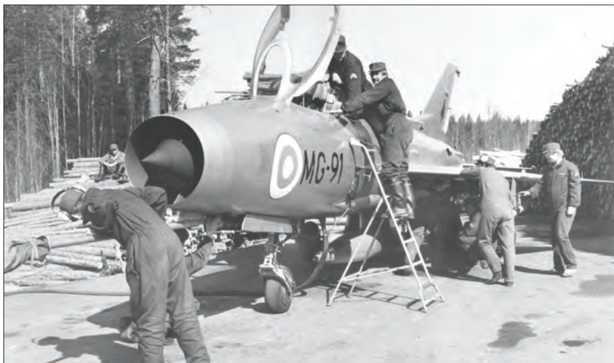
Reserviläisryhmä valmistelee Mikkiä taistelulentäälle maantietukikohdassa.

Siirryin takaisin Laivueeseen 1977. Toimissani koin vaikeuksia. Yritin järjestää käyttöhuollon taistelutilannetta vastaavaksi. Esityksessäni näytin kuvan MG:stä, jossa ryhmä tarkasti konetta. Valmistelu seuraavaan tehtävään kesti alle 10 minuuttia. Laadin kaaviot MG-koneille taulukot huolloista ja lentotoiminnasta, kuten harjoituskoneille aikaisemminkin. ➔